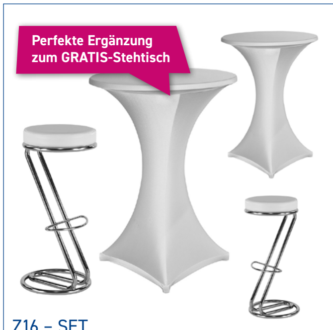
Z16 - SET